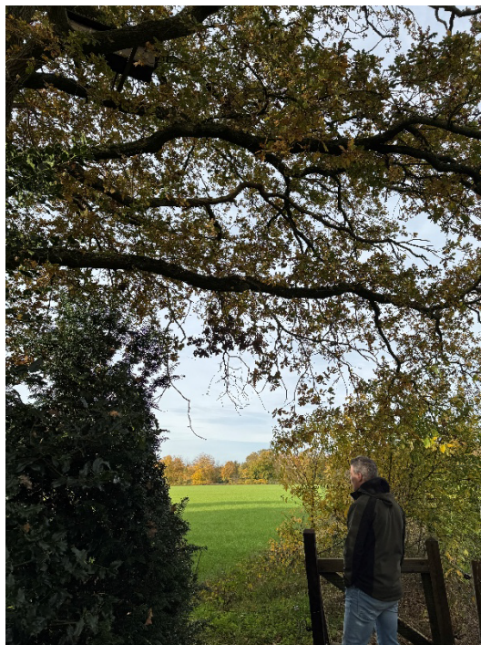
Het liefdeslaantje en mooie wandelpaden langs de rand van de camping.