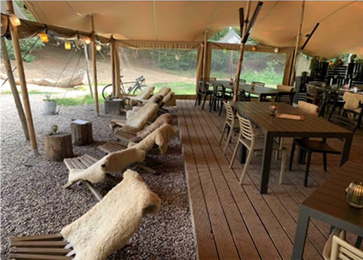
Leuk voorbeeld van een hippe terras uitbreiding