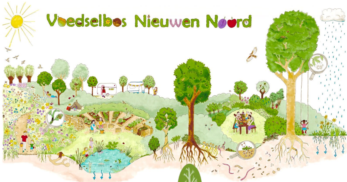
Voorbeelden van een lekker natuursfeer

Hieronder wat voorbeelden op een rij van illustraties, logo's en huisstijlen die daarbij zouden kunnen passen.